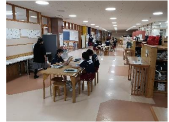
昼休みの学習のようす