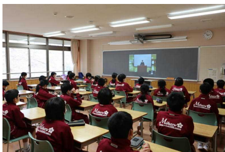
【リモートでの新入生歓迎会】

明日からは風薫る5月となります。新年度がスタートして間もなく1ヵ月が経とうとしています。1年生は学校生活にも慣れてきて、学習に、部活動に、新しい友達とともに頑張っています。2年生も新しい級友とともに、先輩としての自覚を持ちながら日々生活しています。3年生は最上級生として、落ち着いて生活するとともに、最後の中体連総合大会にむけて頑張っている運動部や、目標をもって日々の活動を行っている吹奏楽、合唱、文化部の様子が見られます。新型コロナウイルス感染者が県内においても増加傾向であり予断を許さない状況ではありますが、子どもたちそれぞれの目標が達成できるよう、学校としても工夫して取り組んでまいりたいと考えております。