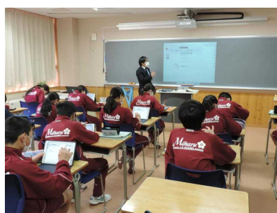
【電子黒板 タブレットを用いた授業】