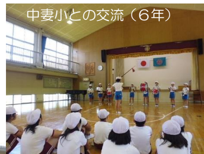
中妻小との交流(6年)

学校ホームページに「さくらっ子」の全面カラー版を掲載しております。ぜひご活用ください。