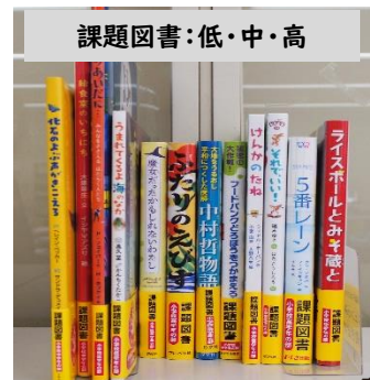
課題図書:低・中・高

なつやす あ みはるまち ほん はい たの がっこう か 夏休み明けには、三春町よりたくさんの本が入ります。楽しみにしててください。また、学校から借りた ほん 本は、「本のびょういん」へ行かないよう大切に使用してくださいね。