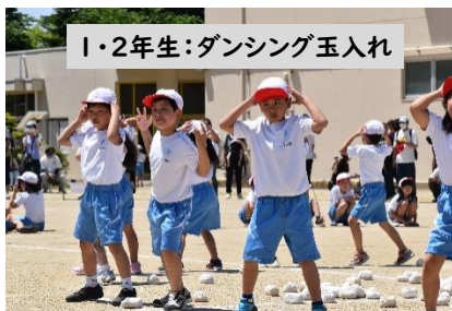
1・2年生：ダンシング玉入れ

みぎがわ よ こ いわえしょうがっこう 右側のQRコードを読み込むと、岩江小学校のホームページを