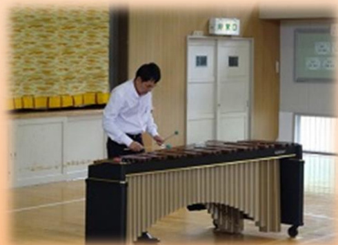
（第2部：マリンバ演奏会）