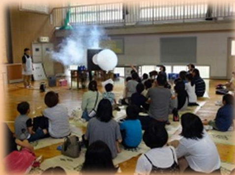
（第1部：サイエンスショー）

当日ご参加いただいた保護者の皆様、運営にご協力いただいた役員の皆様、本当にありがとうございました。