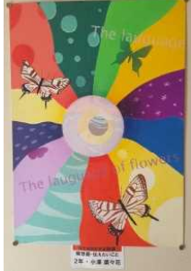
The love of flow 2年・小澤 菜々花