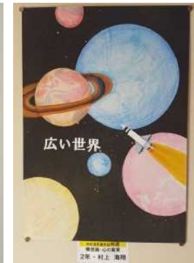
広い世界 2年・村上 海翔