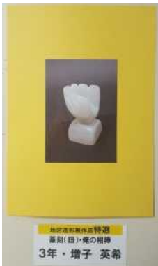
希望の星 3年・増子 英希