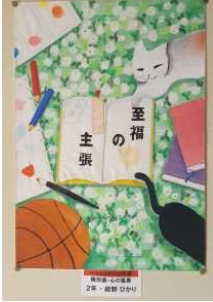
至福の主張 2年・紺野 ひかり