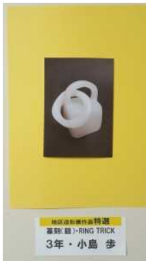
RING TRICK 3年・小島 歩