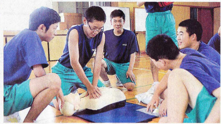
心肺蘇生法の講習を受ける生徒

それが今年度早い時期に実現しました。校内だけではなく、いつ、どこでも、どんな不測の事態に遭遇するか分かりません。そんなときにこそ、『訓練』がものを言います。日赤の救急法講習会を活用し、生徒自らが先生方と一緒に、実際に救急法やAEDの使用法等について学びました。「一度やったから。」というのではなく、今後も、『自らの命を自ら守れる生徒』をめざし、安全・安心面からも『自立』できる子どもづくりに取り組んでまいります。