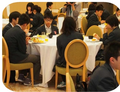
3日目シェルトンの朝食風景