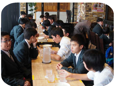
締めくくりの最後の昼食