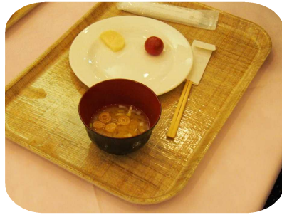
2日目のある子の朝食