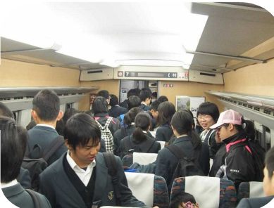
新幹線車内「僕の席は？」