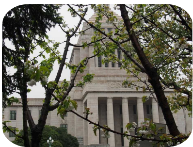
急ぎ足で国会見学