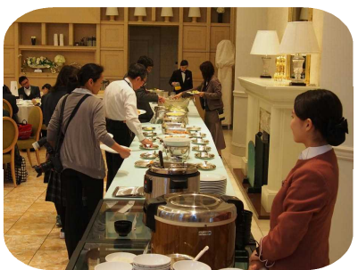
さて、我々も「いただきます。」