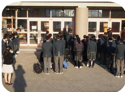
教頭先生に「行ってきます。」