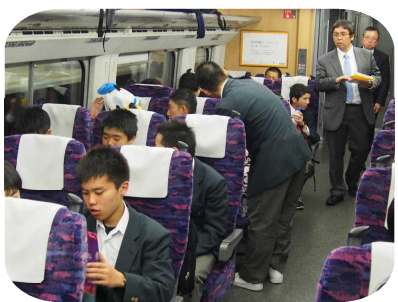
帰りの新幹線の車中