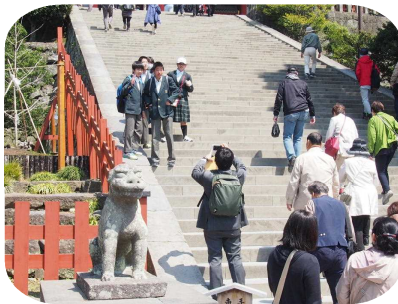
鶴岡八幡宮で学先生パチリ！