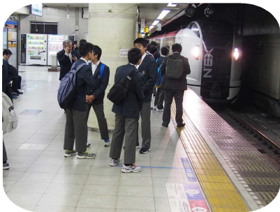
20分遅れ。東京から鎌倉へ。