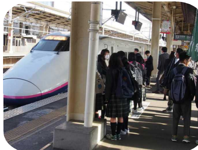
郡山駅で新幹線に乗車