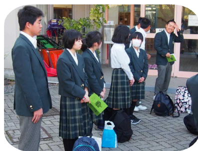
解散式で「楽しかった。」