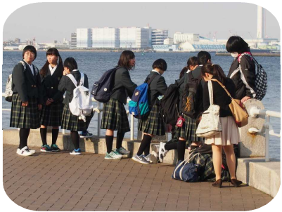
山下公園氷川丸集合