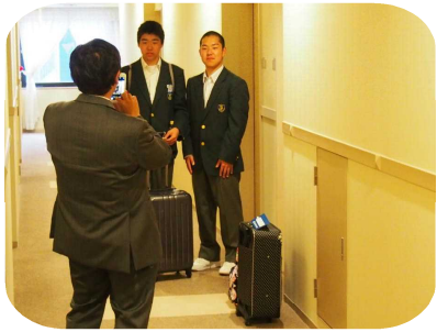
第1日目の夜、新宿のホテルで。