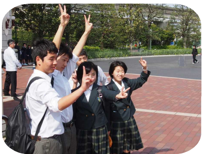
ディズニーに無事到着